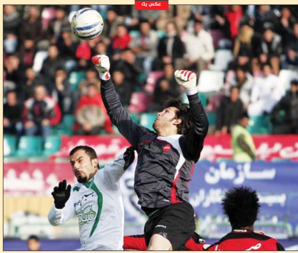
اکبرین برقی هفته بیست و سوم دولت تیم ملی است که در جدول رده بندی هفدهم هستند. برنسیلیوس تیم نهم جدول است با گرفتن ۲۹ امتیاز حاصل از ۷ برد، ۸ مساوی و ۷ باخت و فوب آهن با یک امتیاز کمتر حاصل از ۶ برد.